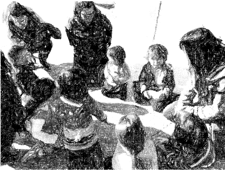
Εικόνα 2-Παιδική συνέλευση του Μικρού Δέντρου σε εκδρομή στο λιμάνι

Ο καθένας και η καθεμία κυκλικά θέλησαν να πουν αν έχουν επισκεφθεί ή όχι το λιμάνι. Αμέσως μετά, ομόφωνα πάρθηκε η απόφαση για εκδρομή στο λιμάνι της Θεσσαλονίκης.