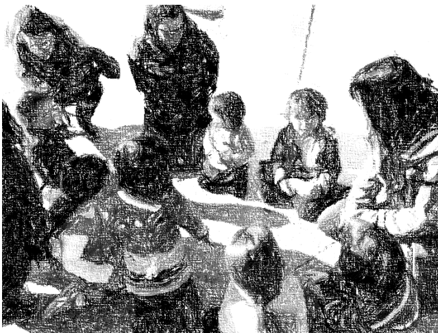
Εικόνα 2-Παιδική συνέλευση του Μικρού Δέντρου σε εκδρομή στο λιμάνι

[ http://theanarchistlibrary.org/category/author/george-cairncross (5-11-15), μτφρ. Μικρό Δέντρο]