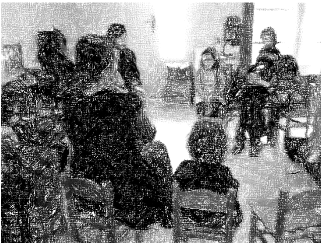
Εικόνα 1-Παιδική συνέλευση στο Μικρό Δέντρο

- Το Νησί της Αλφαβήτου , τεύχη 3 και 7, { http://www.black-tracker.gr/details.php?id=266 }